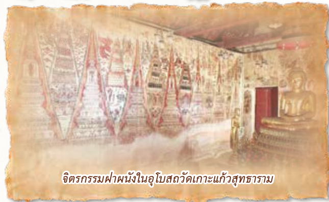
จิตรกรรมฝาผนังในอุโบสถวัดเกาะแก้วสุทธาราม

จิตรกรรมสมัยอยุธยาที่เมืองเพชรบุรี เป็นมรดก ภูมิปัญญาล้ำค่า ที่ชาวไทยต้องสงวนรักษาไว้เป็นสมบัติ ของชาติสืบไป