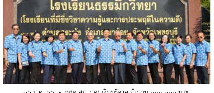
๗ ธ.ค. ๖๖ • สสอ.ศธ. มอบเงินบริจาค ๑๐๐,๐๐๐ บาท ให้มูลนิธิราชประชานุเคราะห์ ในพระบรมราชูปถัมภ์ เพื่อใช้ในกิจการ และดำเนินงานด้านบรรเทาทุกข์แก่ราษฎรที่ประสบภัยพิบัติทางธรรมชาติ