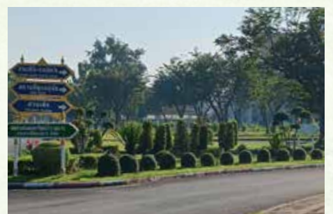
สวนที่ ๓ • ทางออกสนามด้านทิศใต้