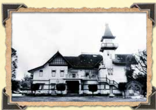
วังสวนกุหลาบ สถานที่จัดแสดงเรื่องเงาป่า สมัย ร.๖

ต่อมาในรัชกาลพระบาทสมเด็จพระมงกุฎเกล้า เจ้าอยู่หัว รัชกาลที่ ๖ พระอัครชายาเธอ กรมขุนสุทธาสินี นาฏ เสด็จประทับที่ตำหนักในสวนสุนันทาเป็นการถาวร ทรงโปรดให้มีการจัดแสดงดนตรีและละครรำในโอกาส พิเศษ เช่น งานฉลองวันประสูติ การรับเสด็จในการ เสวยพระกระยาหารกลางวันของสมเด็จพระเจ้าฟ้าฯ กรมพระ นครสวรรค์วรพินิต เป็นต้น ในขณะที่ดนตรีและละคร ในราชสำนักของพระเจ้าอยู่หัวรัชกาลที่ ๖ ไม่เคยจัดบรรเลง หรือแสดงละครจากบทพระราชนิพนธ์เรื่องเงาป่านี้เลย แต่กระนั้นเรื่องเงาป่า ก็เป็นที่รู้จักแพร่หลาย เพราะ นอกจากในวังสวนสุนันทาแล้ว คณะละครวังสวนกุหลาบ ของสมเด็จพระอนุชาธิราชเจ้าฟ้าฯ กรมหลวงนครราชสีมา ก็ได้จัดแสดงอยู่บ่อยครั้ง อีกทั้งเนื้อเรื่องมีบทสรุปที่ เป็นโศกนาฏกรรมที่สะเทือนใจผู้ชมผู้ฟัง และมีการนำบท สำหรับขับร้อง บรรเลง หรือจัดแสดงเป็นการเฉพาะ เช่น บทชมผีเสื้อ บทนางกอย เป็นต้น บทพระราชนิพนธ์เรื่อง เงาป่า จึงเป็นที่รู้จักแพร่หลายด้วยเหตุนี้