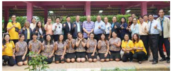
๑๗ ธ.ค. ๖๖ • สอ.ศธ. ร่วมกับ วิทยาลัยเทคนิคกาญจนาบุรี มอบห้องน้ำ ๑ หลัง ๔ ห้อง สนามเด็กเล่น และเปลี่ยนระบบไฟฟ้าภายในอาคาร มูลค่ารวม ๑๔๖,๓๖๕.๑๓ บาท ให้เด็กนักเรียน โรงเรียนตำรวจตระเวนชายแดนบ้านประตูด่าน จังหวัดกาญจนบุรี