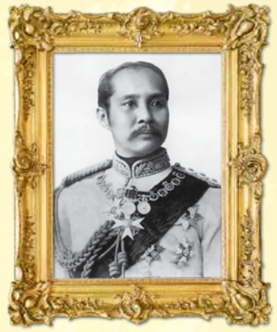
พระบาทสมเด็จพระจุลจอมเกล้าเจ้าอยู่หัว รัชกาลที่ ๕