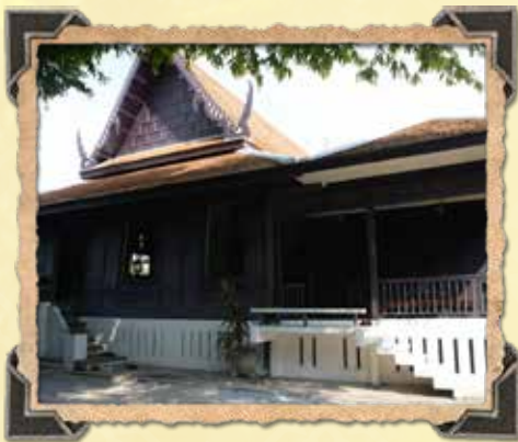
วังบ้านหม้อ ที่ตั้งกรมมหรสพ ซึ่งได้ส่งครูดนตรีมาบรรจเพลงเรื่องเงาะป่า เมื่อ พ.ศ. ๒๔๔๕

เมื่อบทพระราชนิพนธ์เรื่องเงาะป่าสำเร็จสมบูรณ์ พระอัครชายาเธอ กรมขุนสุทธาสินีนาฏ ได้ทรงรับเป็นธุระดำเนินการให้มีการบรรจเพลง และฝึกหัดขับร้อง ทรงทุ่มเทอย่างสุดพระกำลังสามารถ เพราะทรงทราบเรื่องบทกลอน บทละคร บทเพลง วงดนตรีในรูปแบบต่างๆ มาแต่ครั้งทรงพระเยาว์ และที่สำคัญ มีพระปรีชาสามารถเฉลียวฉลาด พร้อมทั้งทรงรู้จักครูดนตรีมากมายหลายท่าน ที่จะช่วยสนองงานพระราชนิพนธ์นี้ให้งดงามเสร็จสิ้นได้โดยเร็ว และถูกพระทัยพระบาทสมเด็จพระจุลจอมเกล้าเจ้าอยู่หัว งานดนตรีนั้นท่านทำมาก่อนจะได้รับบทพระราชนิพนธ์เรื่องเงาะป่า จัดให้ข้าหลวงขับร้องถวาย โดยใช้บทละครเรื่องอิเหนา