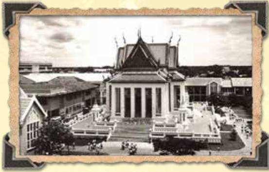
โรงเรียนนาฏดุริยางคศาสตร์ สังกัดกรมศิลปากร กระทรวงวัฒนธรรม พ.ศ. ๒๔๗๗