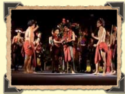
การแสดงละครเงาะป่าของสวนสุนันทา แสดงประเพณีการแต่งงาน

บทพระราชนิพนธ์เรื่องเงาะป่า ในทางวรรณคดี นับเป็นวรรณคดีที่มีคุณค่ายิ่งเรื่องแรกของไทยที่กล่าวถึงบทชมธรรมชาติ บทรัก บทแค้น บทโศก บทขบขัน และคติธรรมของพวกเงาะป่า มีการใช้ถ้อยคำสำนวนง่าย ๆ สละสลวย มีรสสัมผัส เป็นภาพพจน์และมีอุปมาอุปไมย แยกคายมากมาย แสดงให้เห็นวัฒนธรรมของพวกเงาะด้านภาษา การแต่งกาย ความเป็นอยู่ ประเพณี ความเชื่อ การทำมาหากิน เป็นต้น ให้แง่คิดในเรื่องความรักพิสุจน์ได้ด้วยการเสียดสี เป็นต้น บทพระราชนิพนธ์เงาะป่าจึงเป็นวรรณกรรมในลักษณะโศกนาฏกรรม และพัฒนาต่อยอดไปสู่นาฏกรรมที่สมบูรณ์ และนำไปบรรจอยู่ในหลักสูตรการศึกษาให้นักเรียนทุกระดับประถม มัธยม และอุดมศึกษา ได้ศึกษาต่อไปอย่างไม่มีวันสิ้นสุด