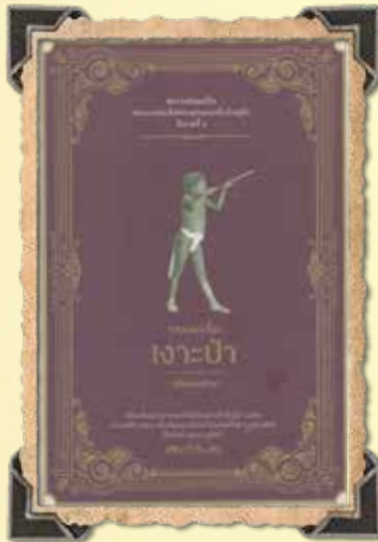
บทละครพระราชนิพนธ์เรื่องเงาะป่า