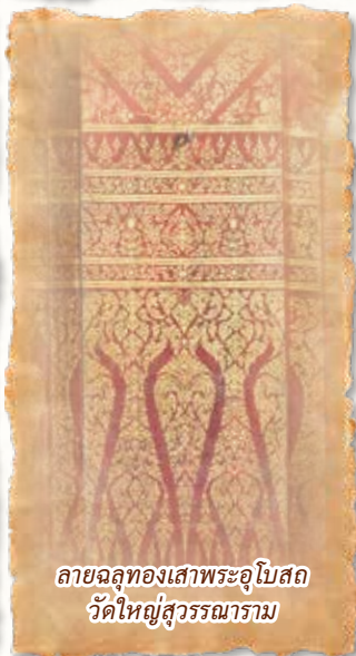
ลายฉลุทองเสาพระอุโบสถ วัดใหญ่สุวรรณาราม

ศาลาการเปรียญเครื่องไม้ ตามประวัติว่า สมเด็จพระเจ้าเสือถวายท้องพระโรงมาสร้างเป็นศาลาการเปรียญ ภายในเขียนจิตรกรรมภาพสัตว์และพรรณพฤกษา บานหน้าต่างด้านในเขียนภาพบุคคล ฝีมือช่างสมัยอยุธยา ตอนปลาย