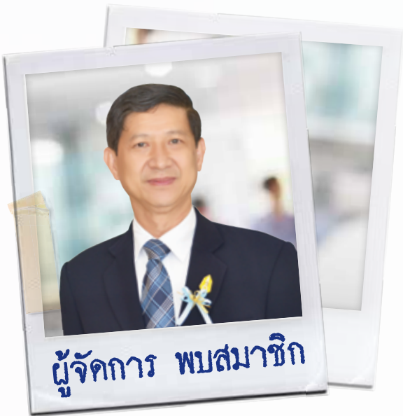
ผู้จัดการ พบสมาชิก