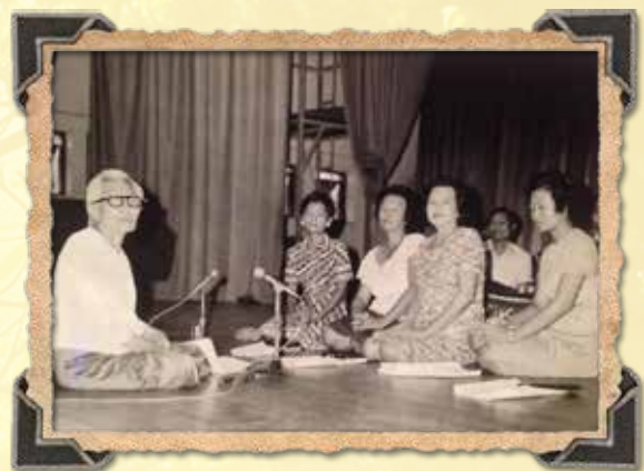
เจ้าจอม ม.ร.ว. สดับ ถ่ายทอดเพลงเงาป่าให้ศิลปินกรมศิลปากร

บทพระราชนิพนธ์เรื่องเงาป่าในเบื้องต้นได้บรรจุ เพลงไว้สำหรับประกอบการขับร้องและบรรเลงเท่านั้น ต่อมาพระบาทสมเด็จพระจุลจอมเกล้าเจ้าอยู่หัว ทรงมี พระราชดำริจัดให้เตรียมจัดแสดงเป็นละคร ได้ทรงติดต่อ บทสำหรับการแสดงละครด้วยพระองค์เอง ส่วนบทร้องนั้น ทรงพระกรุณาโปรดเกล้าฯ ให้แสดงเป็นคอนเสิร์ตใน งานพระราชทานเลี้ยงพระกระยาหารกลางวัน ในการฉลอง เลื่อนพระอิสริยยศ สมเด็จพระเจ้าลูกยาเธอฯ กรมขุนลพบุรี ราเมศวร์ และพระเจ้าลูกยาเธอฯ กรมหมื่นกำแพงเพชร อัครโยธิน ส่วนการจัดแสดงนั้น โปรดให้จัดแสดงในงาน เฉลิมพระที่นั่งอัมพรสถานเมื่อปี พ.ศ. ๒๔๔๕ ละคร ประสบความสำเร็จด้วยดีเป็นที่พอพระราชหฤทัย ซึ่งเป็ นการจัดแสดงในสมัยรัชกาลที่ ๕ เพียงครั้งเดียว (เสาวณิต วิงวอน. ๒๔๒-๒๔๓ : ๒๕๕๕)