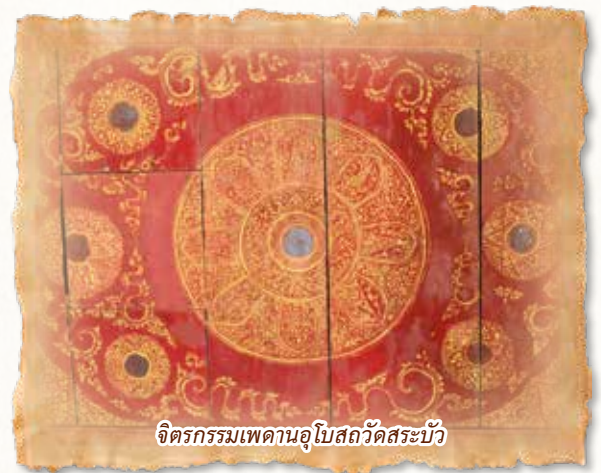
จิตรกรรมเพดานอุโบสถวัดสระบัว

วัดสระบัว ตำบลคลองกระแซง อำเภอเมือง จังหวัดเพชรบุรี อุโบสถขนาดเล็กประดับลายปูนปั้นงดงามยิ่ง เพดานอุโบสถและบานประตูหน้าต่างเขียนภาพจิตรกรรมสันนิษฐานว่าเป็นฝีมือช่างสมัยกรุงศรีอยุธยา ราวรัชกาลสมเด็จพระเจ้าปราสาททอง