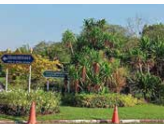
สวนที่ ๑ วงเวียนด้านทิศเหนือ