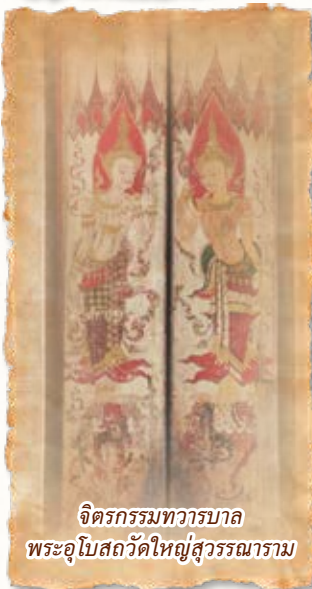
จิตรกรรมทวารบาล พระอุโบสถวัดใหญ่สุวรรณาราม