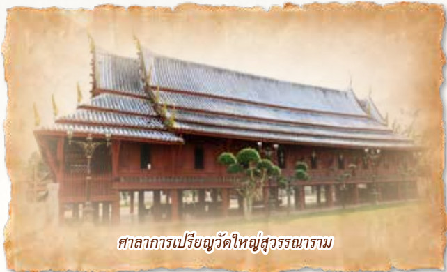
ศาลาการเปรียญวัดใหญ่สุวรรณาราม

“...โบสถ์นั้น มีเสาลายปิดแบบลายต่างกัน พื้นแดง ผูกดี ๆ ฝาเขียนเบญจรงค์ด้านหน้ามารพจญ แต่ลบเสีย มาก เห็นไม่ใคร่ได้ ด้านข้างเทพชุมนุม มีอินทร พรหม เทวดา ยักษ์ นาค ครุฑ วิชาธร บานประตูกลางหน้า เทวดายืน ดีเต็มที...”