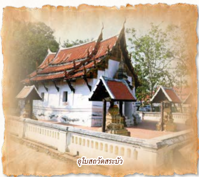
อุโบสถวัดสระบัว

ชาวเมืองเพชรบุรีตั้งแต่อดีตจนถึงปัจจุบันมีความศรัทธาในพระพุทธศาสนาอย่างแน่นแฟ้น เป็นที่ประจักษ์ชัดว่าวัดวาอารามซึ่งเป็นศูนย์กลางของชุมชนสร้างสรรค์ขึ้นมาอย่างประณีตวิจิตรงดงามด้วยฝีมือช่างชั้นครู ตามขนบของศิลปกรรมไทยประเพณี