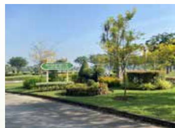
สวนที่ ๒ วงเวียนด้านทิศใต้