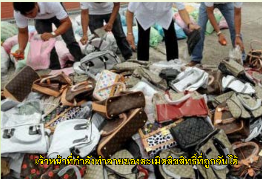
เจ้าหน้าที่กำลังทำลายของละเมิดลิขสิทธิ์ที่ถูกจับได้

สำหรับประเทศไทยการที่จะช่วยให้เกิดการเปลี่ยนแปลงคนจนส่วนใหญ่ โดยเฉพาะอย่างยิ่งในภาคเกษตรกรรม ให้กลายเป็นคนรวย หรือมีคุณภาพชีวิตที่ดีขึ้นอย่างทั่วถึงเป็นสิ่งที่ยาก