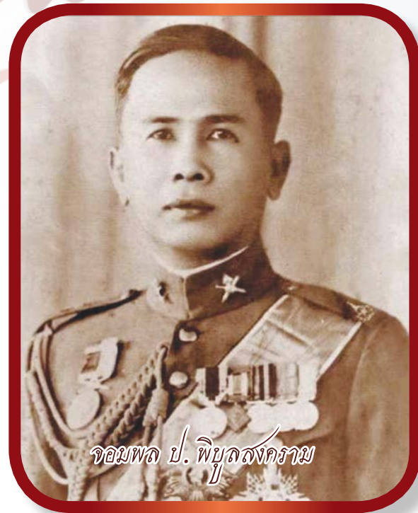
จอมพล ป. พิบูลสงคราม

การเปลี่ยนวันขึ้นปีใหม่ของไทยครั้งล่าสุดเกิดขึ้น ในสมัยรัฐบาลของหลวงพิบูลสงคราม หรือที่หลายคน รู้จักในนามของจอมพล ป.(แปลก) พิบูลสงคราม นายก รัฐมนตรี ผู้ริเริ่มแนวคิด รัฐนิยม ที่ต้องการนำพาชาว สยามก้าวสู่สิ่งที่เรียกว่า ความศิวิไล ของผู้มีอารยะ ใน สมัยนี้มีการเปลี่ยนชื่อให้ทันสมัย แต่งกายแบบตะวันตก