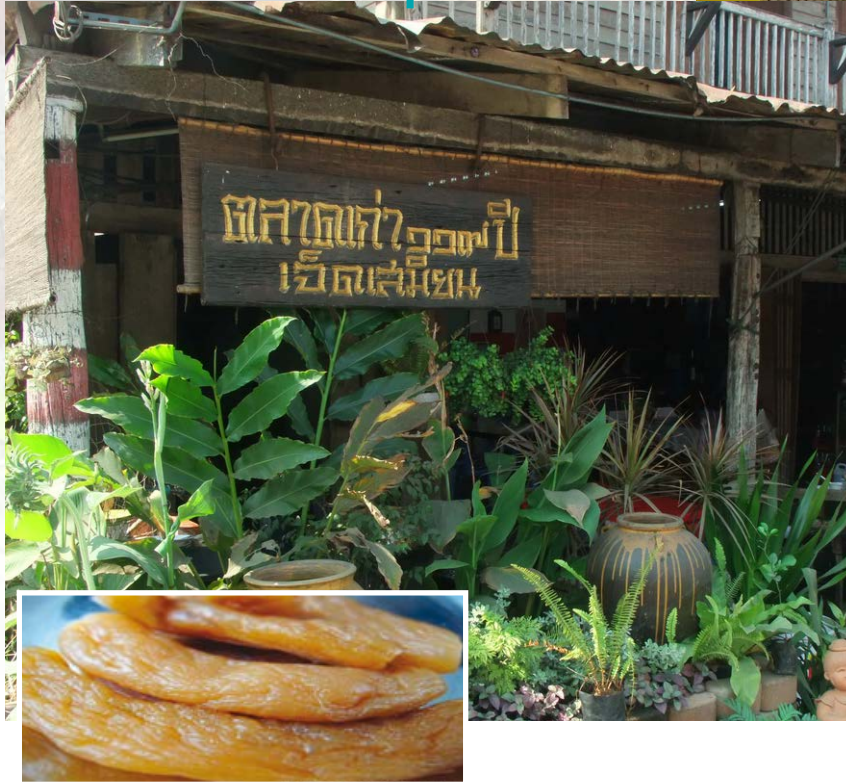
หัวไชโป้ว ตลาดเจ็ดเสมียน