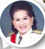
โดย...หิ่งห้อย

วัน เดือน ปี ผ่านไปเร็วเสียจริง และกำลังต้องเปลี่ยนปีพุทธศักราชเป็น ๒๕๕๖ ในอีกไม่ช้านี้ ผู้เขียนจึงนำเสนอเครื่องมือบอก วัน เดือน ปี ซึ่งรวมๆ แล้วนับได้ ๑ ปี การนับเวลาเป็นปีก็แตกต่างกันไปตามวิถีของมนุษยชาติ ซึ่งกำหนดขึ้นตามชาติพันธุ์ เช่น ศาสนาพุทธนับจากพระพุทธเจ้าเสด็จปรินิพพาน เป็นพุทธศักราช คำย่อ พ.ศ. ส่วนศาสนาคริสต์นับนับแต่พระเยซูเจ้าประสูติ เป็นคริสต์ศักราช คำย่อคือ ค.ศ.