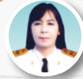
วิมลรัตน์ ต้อยสารานู เรียบเรียง