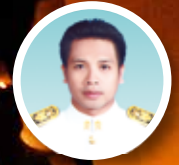
เจริญ กุจิฉัตร เรียบเรียง

ใกล้ถึงเทศกาลลอยกระทงประจำปี ๒๕๕๕ กันแล้ว ครบ ซึ่งปีนี้ตรงกับวันที่ ๒๘ พฤศจิกายน ๒๕๕๕ เชื่อว่าท่านสมาชิก สอ.ศธ. หลายท่านคงเตรียมตัวพาครอบครัวอันแสนอบอุ่น ควงหวานใจ หรือเพื่อนสนิท ไปลอยกระทงร่วมกันที่ใดที่หนึ่งเป็นแน่แท้ อย่างไรก็ตาม...ก่อนที่จะไปลอยกระทงกันนั้น เรามาทำความรู้จักประเพณีลอยกระทงสักหน่อยก่อนดีกว่านะครั้น เพื่อจะได้เข้าใจถึงประวัติความเป็นมาของประเพณีลอยกระทง และการร่วมเทศกาลลอยกระทงอย่างสร้างสรรค์