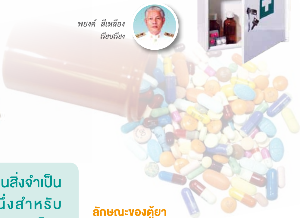
พยงค์ สีเหลือง เรียบเรียง