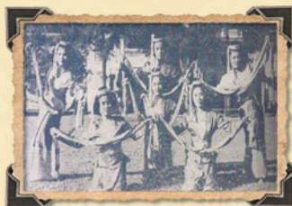
ฟ้อนม่านม้วยเชียงดา งานศิลปหัตถกรรมนักเรียน ปี พ.ศ. ๒๔๕๓

ชุบชีวิตขึ้นมาให้เป็นที่รู้จักของสังคม ในรูปแบบละครของโรงเรียนสวนสุนันทาวิทยาลัย และที่ควรบันทึกไว้คือช่วงที่รัฐบาลสมัยรัฐบาลนิยมได้ส่งเสริม “วัฒนธรรมแห่งชาติ” ของชาติ สภาวัฒนธรรมแห่งชาติในสมัยนั้นได้มอบให้โรงเรียนสวนสุนันทาวิทยาลัยได้รับหน้าที่เป็นสถานที่ฝึกซ้อมร้วางมาตรฐานตามแบบของกรมศิลปากร เพราะได้พิสูจน์ให้เห็นแล้วว่าโรงเรียนแห่งนี้มีพื้นฐานที่เข้มแข็งจากละครวังสวนสุนันทามาแต่เดิม