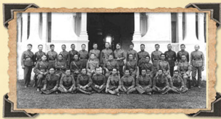
คณะราชฎ์ ผู้ก่อการอภิวัฒน์ ๒๔๗๕

จะเห็นได้ว่าละครในสวนสุนันทาได้ถือกำเนิดขึ้นในราวปี พ.ศ. ๒๔๖๐ เนื่องจากพระดำริของพระเจ้าบรมวงศ์เธอ พระองค์เจ้าอาทรทิพนิภา ซึ่งเป็นแบบอย่างให้เจ้านายตำแหน่งอื่นๆ ทรงละครหรือวงดนตรีขึ้นบ้าง ทำนองประชันกันเล็กๆ น้อยๆ ซึ่งเจริญขึ้นตามกาลเวลาถึงขีดสุดเมื่อได้ทรงกำหนดให้มีการเรียนการสอนอย่างจริงจัง โดยครูนาฏศิลป์คนสำคัญอย่างเจ้าจอมมารดาเขียน ในรัชกาลที่ ๔ ทั้งได้กลุ่มผู้บรรเลงดนตรีมาจากแผนกปีพาทย์หลวงสังกัดกระทรวงวัง ทั้งยังได้มีโอกาสออกแสดงฝีมือในงานสำคัญ แม้จะเป็นงานที่จัดกันขึ้นเป็นการภายใน แต่ก็นับว่าเป็นเวทีในการแสดงฝีมือและผลงานของ “คณะละครวังสวนสุนันทา” นี้อย่างแท้จริงจนถึงคราวสะอึกลงเมื่อปี พ.ศ. ๒๔๗๕ ด้วยเกิดการเปลี่ยนแปลงการปกครอง พระบรมวงศานุวงศ์เสด็จออกไปประทับภายนอกวังสวนสุนันทาจนหมดสิ้น เป็นยุค “พินาศเจ้าเมื่อคราววังแตก” เจ้านายบางพระองค์เสด็จออกไปประทับต่างประเทศ เช่น ที่เมืองบันดุง ประเทศอินโดนีเซีย บางพระองค์เสด็จไปประทับอยู่กับพระญาตินอกวังสวนสุนันทา แม้จะไม่มีเหตุการณ์รุนแรง แต่ก็ทำให้วิถีชีวิตแบบชาววังสูญสลายไปจนหมดเกือบสิ้น