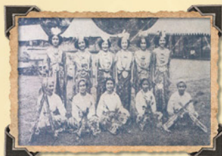
ระบำชาว งานศิลปหัตถกรรมนักเรียน ปี พ.ศ. ๒๔๕๓