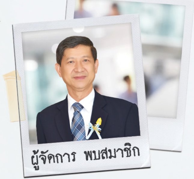
ผู้จัดการ พบสมาชิก