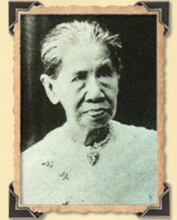
เจ้าจอมมารดาเขียน ในรัชกาลที่ ๔

อย่างแม่นยำขึ้นใจ อย่างไรก็ดี แม้นักแสดงจะเก่งกาจเพียงใด การออกงานสำคัญ หรืองานใหญ่ๆ ยังนับว่าน้อยนัก เพราะในช่วงเวลานั้นตรงกับช่วงต้นรัชกาลที่ ๗ พระบรมวงศ์ชั้นสูงทยอยกันทิวงคตและสิ้นพระชนม์ติดๆ กันหลาย