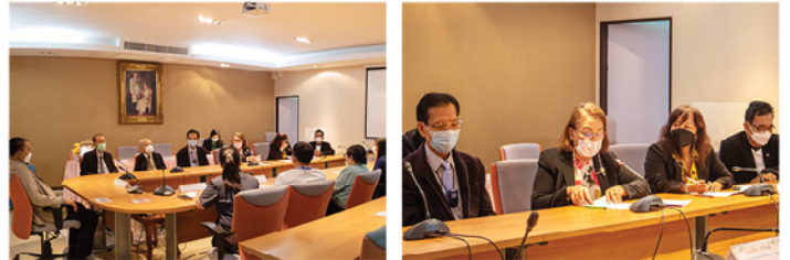
๒๒ มิ.ย. ๖๕ • สอ.ศธ. จัดโครงการสหกรณ์สัญจรพบผู้บริหาร ในหน่วยงานของสมาชิก ณ วิทยาลัยพาณิชย์การบางนา