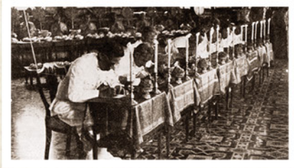
การจารึกพระสุพรรณบัฏ พระราชพิธีบรมราชาภิเษกพระบาทสมเด็จพระเจ้าอยู่หัว รัชกาลที่ ๕ เมื่อวันที่ ๒๐ เมษายน พุทธศักราช ๒๔๕๓

“พระพุทธรูปยอคฟ้าจุฬาโลกย์” กับ “พระพุทธรูปเลิศล้ำสุราไลย” ทั้งทรงกำหนดให้ใช้พระนามพระพุทธรูปนั้นเป็นพระนามแผ่นดินรัชกาลที่ ๑ และรัชกาลที่ ๒ ต่อมาถึงรัชกาลที่ ๔ พระบาทสมเด็จพระจอมเกล้าเจ้าอยู่หัว ทรงเปลี่ยนพระนามพระพุทธรูปแทนพระองค์รัชกาลที่ ๒ เป็น “พระพุทธรูปเลิศล้ำนภาลัย” และทรงกำหนดพระนามแผ่นดินในรัชกาลที่ ๓ ว่า “พระนั่งเกล้าเจ้าอยู่หัว”