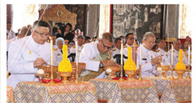
การจารึกพระสุพรรณบัฏ พระราชพิธีบรมราชาภิเษกพระบาทสมเด็จพระเจ้าอยู่หัว รัชกาลที่ ๑๐ เมื่อวันที่ ๒๑ เมษายน พุทธศักราช ๒๕๖๒

“ พระบาทสมเด็จพระปรเมนทรมหาอานันทมหิดล เทพยพงษ์ วิชาดิศวรกรรมศาสตราจารย์ วรชิตยราชนิกรโรตม จาตุรันต บรมมหาจักรพรรดิราชสังกาส อุกาโตสุชาติสังสุทธเสวระธานี จักรกริบรมนาถ อิศรราชรามวโรจักร สุจิตมูล สุสชาติอุกฤษฏ์ วิบูลย์ บุรพาตุลยกฤษฎาภิณหาร สุภาธิการรังสฤษดิ์ อัญญลักษณ์ วิจิตรโสภาคยสรพรพจน์ มหาจโนตมาตสผุสดี ปาทกมทุยตุล ประสิทธิสรพรพจน์ผลลุตม บรมสุขุมาลมหาบุรุษรัตน์ ศิษาพิพัช สรพรโกศล สุวิศตวิมลศภศิลาสมาจาร เพ็ชรญาณประภาไพโรจน์ อเนกโกฏิสานุคุณวิบูลยสันดาน ทิพยเทพาวตารไพศาล เกียรติคุณอดุลพิเศษ สรรพเทเวศรานุรักษ์ เอกคมนาบุรุษ สุดพุทธมหากวี ตรีปิฎกาทิโกศล วิมลปรีชามหาอุดมบัณฑิตย์ สุนทรวิจิตรปฏิภาณ บริบูรณ์คุณสารสยามาติโลกยติลก มหา ปริวารนายกอนันต์ มหันตวรฤทธิเดช สรรพวิเศษศิรินทร มหาจ นิกรสโมสรรสมมติประสิทธิวร ยศมโหดมบรมราชสมบัติ นพปฎล เสวตรฉัตรดิฉัตร ศิริรัตน์โนปลักษณ์มหาบรมราชาภิเศกภักสิต ปรปักษตทิตวิจิตรไชย สกกลมไทสวรรย์มหาสวาณินทร์ มเสศวร มทินทรมหารามาธิราช วัโรตมบรมนารถชาติอาชาวัไลย พุทธา ติไตรรัตนสรณารักษ์ อุกฤษฏ์ศักดิ์อรรัตนเรตราธิบดี เมตตา กรณาสีตลทฤไทย อโนปโหมยบุญญการ สกมลไพศาลมหาธิรญา ธิเบนทร์ ปรเมนทรธรรมิกมหาราชาธิราช บรมนารถบรมบพิตร พระจอมเกล้าเจ้าอยู่หัว ”