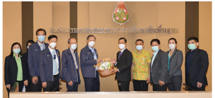
๒๐ ก.ค. ๖๕ • สอ.ศธ. จัดโครงการสหกรณ์สัญจรพบผู้บริหาร ในหน่วยงานของสมาชิก ณ ห้องประชุม สพฐ.๑