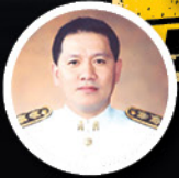
ยศพล เวณโกเศศ