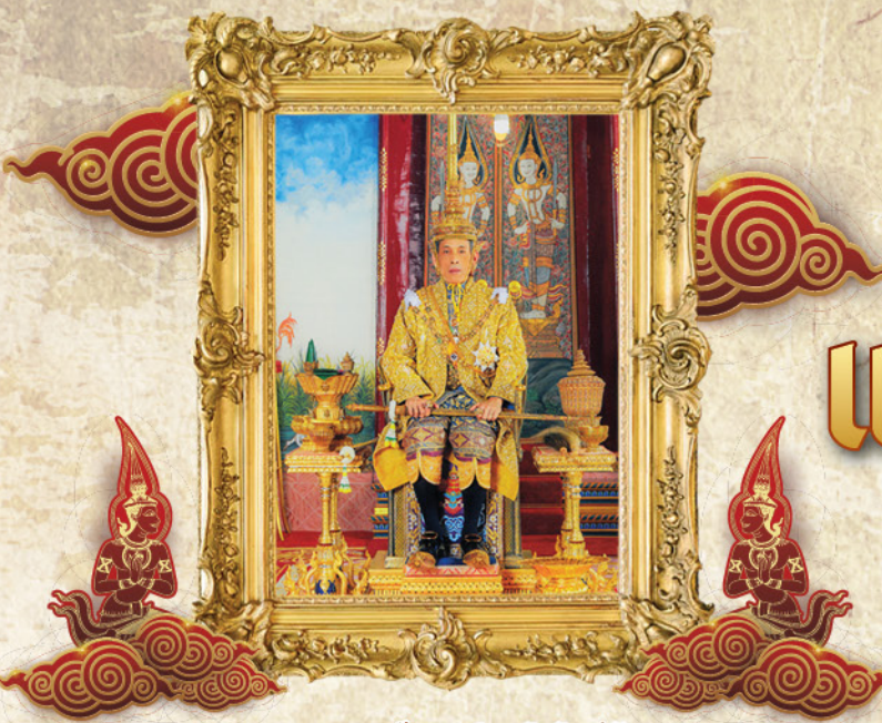
พระบาทสมเด็จพระวชิรเกล้าเจ้าอยู่หัว