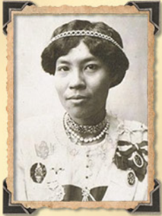
พระเจ้าบรมวงศ์เธอ พระองค์เจ้าอาทรทิพนิภา

เมื่อเจ้าจอมมารดาเขียนในรัชกาลที่ ๔ ได้มาสร้างรูปแบบการเรียนนาฏศิลป์ในวังสวนสุนันทานั้น ท่านได้สร้างแนวทางการเรียนการสอนที่เข้มงวดอย่างโบราณ เพราะท่านเป็นครูละครคนสำคัญ และยังเป็นคนละครหลวงในราชสำนัก