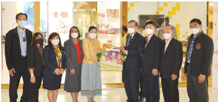
๑ ก.ค. ๖๕ • สอ.ศธ. จัดโครงการสหกรณ์สัญจรพบผู้บริหาร และการให้บริการในหน่วยงานของสมาชิก ณ สำนักงานปลัดกระทรวงวัฒนธรรม