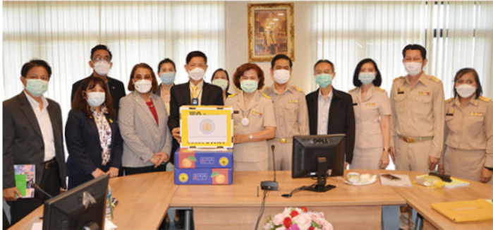
๑๓ มิ.ย. ๖๕ • สอ.ศธ. จัดโครงการสหกรณ์สัญจรพบผู้บริหาร และการให้บริการในหน่วยงานของสมาชิก ณ สถาบันบัณฑิตพัฒนศิลป์