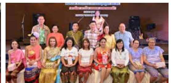
๒๓-๒๔ มิ.ย. ๖๑ - สอ.ศธ. จัดการประชุมสัมมนา "การเสริมสร้างความสัมพันธ์อันดีระหว่างสหกรณ์กับตัวแทนและสมาชิกกลุ่มผู้นำ" ณ โรงแรมแอมบาสซาเดอร์ ซิตี้ จอมเทียน จังหวัดชลบุรี