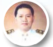
ยศพล เวณุโกเศศ

สวัสดีครับ มวลมิตรพี่น้องสมาชิกสหกรณ์ออมทรัพย์ข้าราชการกระทรวงศึกษาธิการ จำกัด ที่เคารพรักทุกท่าน ถ้าพูดถึงการเป็นหนี้แล้วผมคิดว่าหลายคนหรือทุกคนเลยคงไม่อยากจะเป็น แต่เมื่อเราตัดสินใจที่จะเป็นหนี้แล้ว ควรเลือกหนี้ที่จะสร้างอนาคตหรือความมั่นคงระยะยาว และหลีกเลี่ยงการก่อหนี้ที่ไม่ก่อให้เกิดรายได้เพิ่ม หรือไม่ได้ช่วยเพิ่มความมั่นคงทางการเงิน