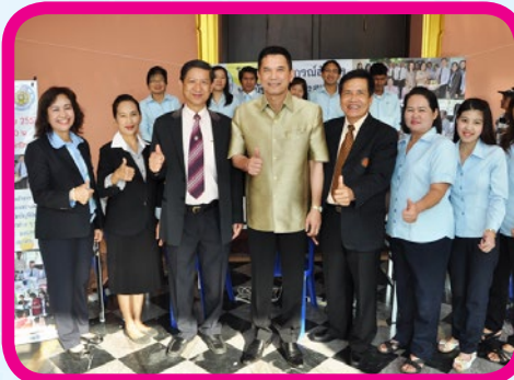
กรมศิลปากร