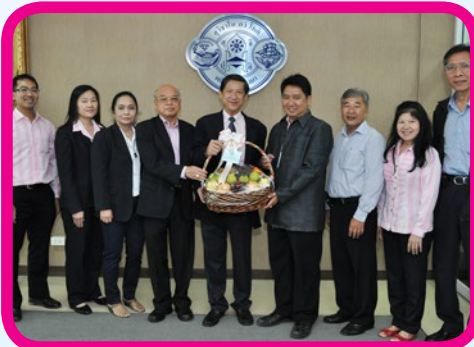
วิทยาลัยพณิชยการบางนา