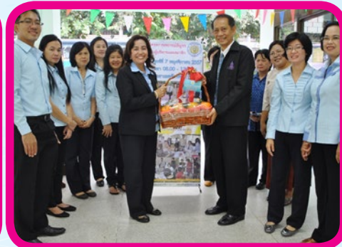
มทร.ตะวันออกวิทยาเขตจุกพงษภูวนารถ